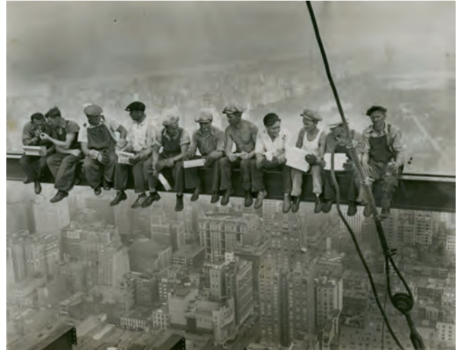
Charles C. Ebbets, Lunchtime Atop the World's Largest Building, Rockefeller Center, New York, 1932. Courtesy of Howard Greenberg Collection